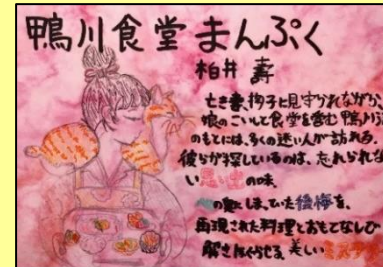
『鴨川食堂まんぶく』柏木圭一郎：著/小学館